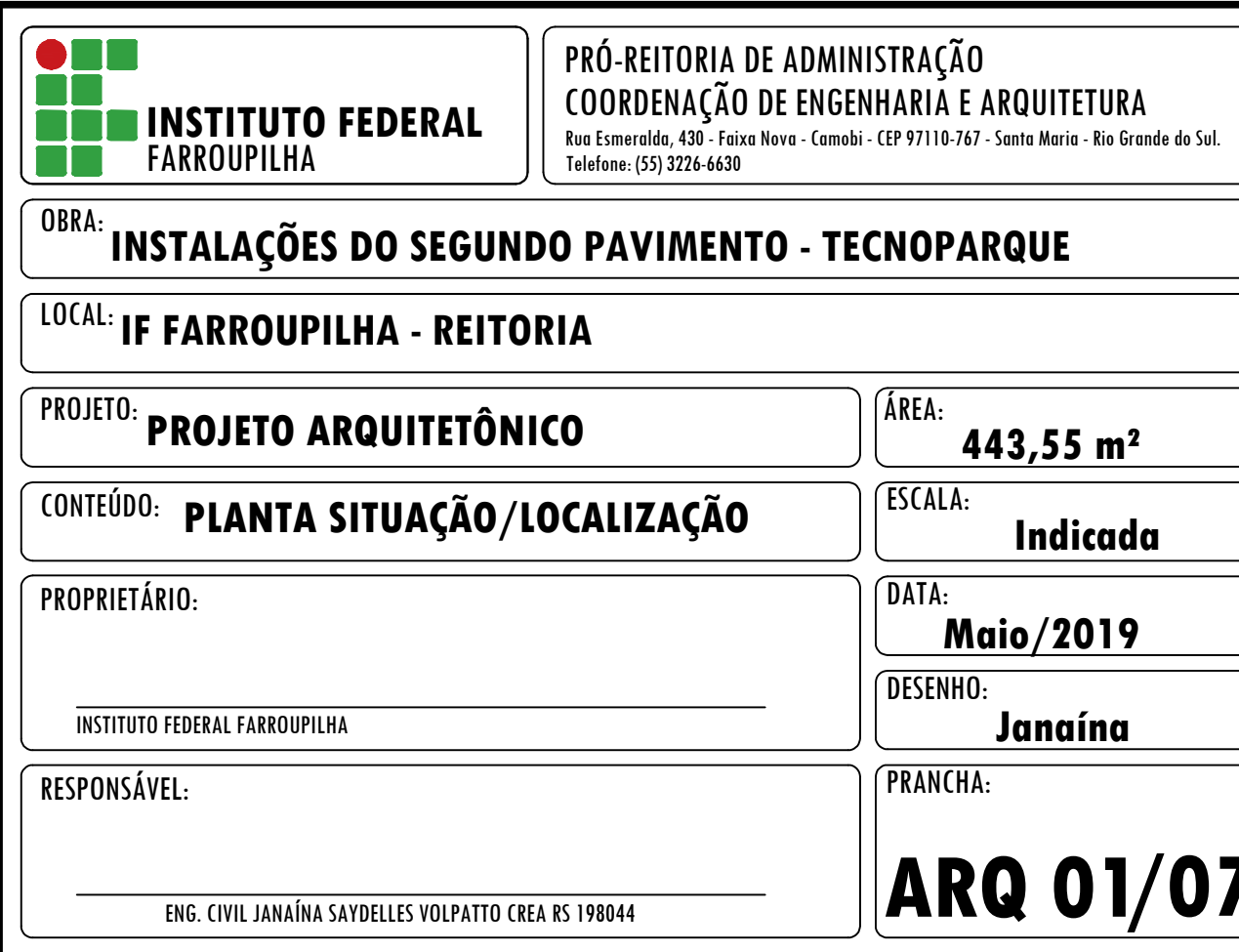
PLANTA DE LOCALIZAÇÃO ESCALA: 1/250